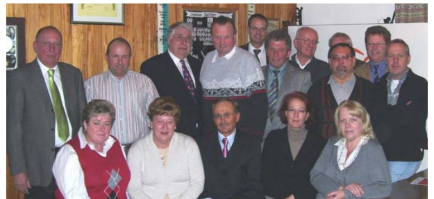
Die Kandidaten der Liste 4

Auch erfahren Sie mehr von uns im Internet unter www.dorfgemeinschaft-alling.de