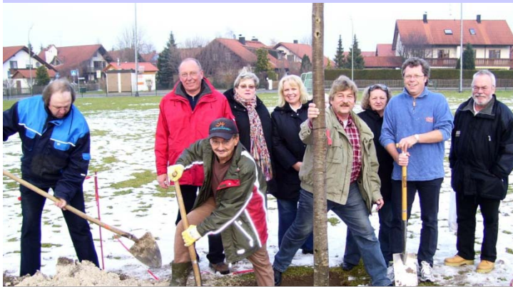
50 Jahre Dorfgemeinschaft Alling Pflanzung der Dorflinde